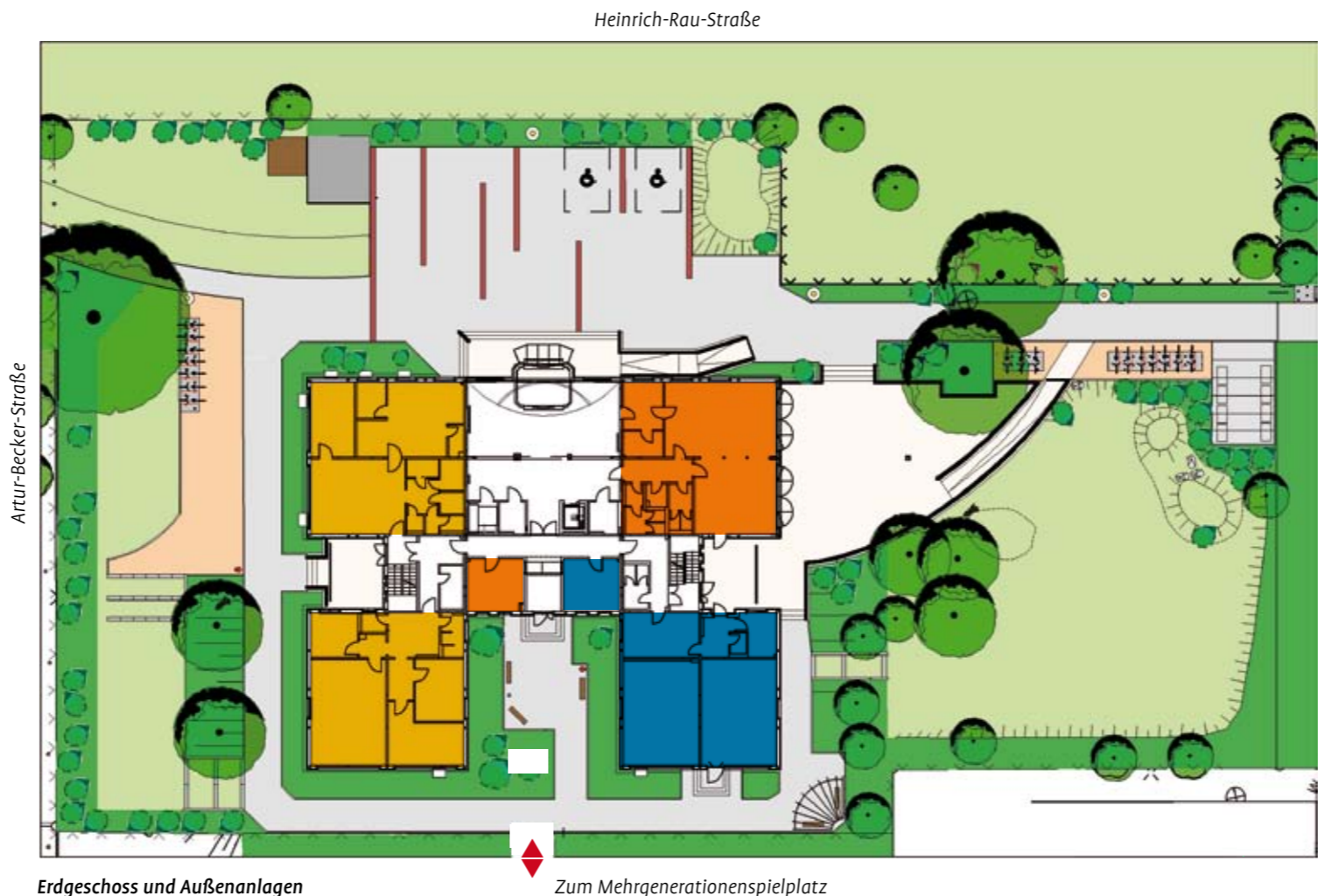
Erdgeschoss und Außenanlagen